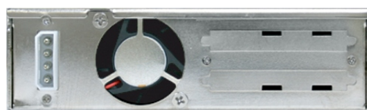
リアビュー ケーブル未装着